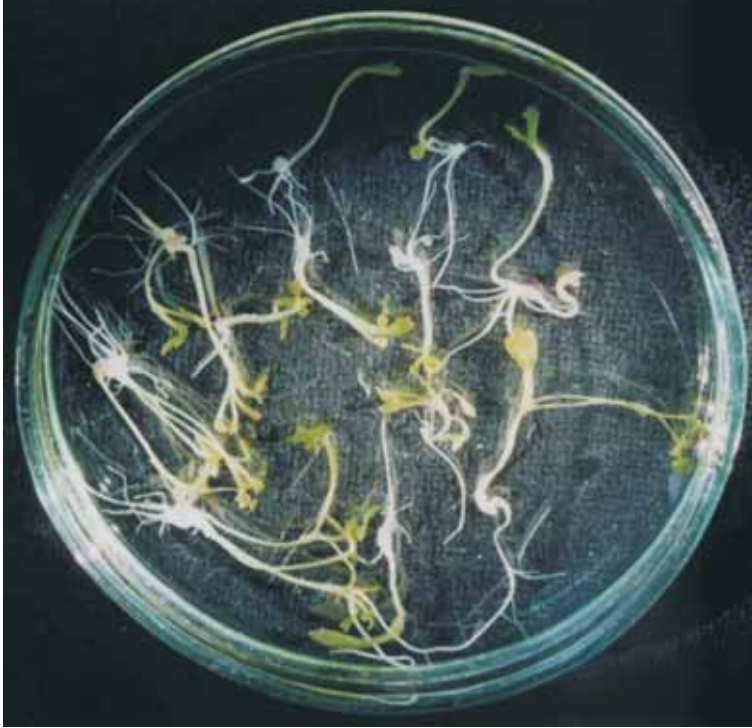
Fot. 3c. Regeneracja jednoetapowa — kompletne rośliny.