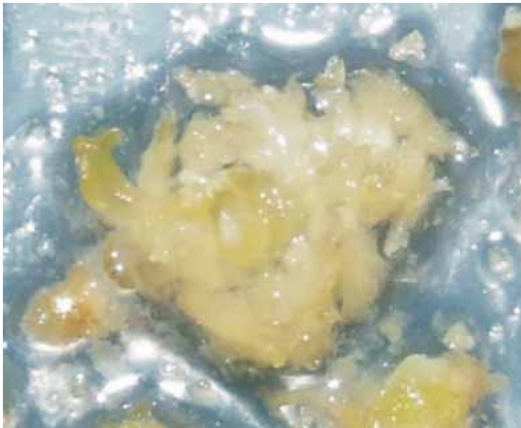
Fot. 3a. Regeneracja jednoetapowa — wtórna embriogeneza.