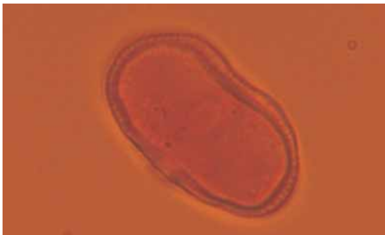
Fot. 1. Mikrospora jednojądrowa.

Izolowane z pąków kwiatowych pylniki marchwi zawierały mikrospory w różnych stadiach rozwojowych z przewagą jednego z nich. Stadium jednojądrowe (fot. 1) okazało się optymalne dla indukcji androgenезы. W przeprowadzonych obserwacjach wykazano, że stadium mikrosporogenezy było skorelowane z długością pąka kwiatowego. Optymalna dla androgenезы długość pąka była różna w zależności od genotypu i wahała się od 0,5 mm do 1,8 mm. Dla odmiany Feria F 1 wynosiła 1,0 mm — 1,3 mm, a dla odmiany HCM 0,5 mm — 0,9 mm. Zagadnienie to zostało dokładnie przedstawione w publikacji Kiszczaka i in. (12), gdzie stwierdzono, że dla każdego genotypu marchwi przed zakładaniem kultur pylnikowych należy