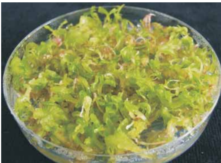
Fot. 3b. Regeneracja jednoetapowa — konwersja zarodków.