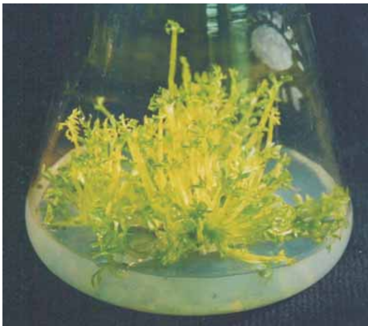
Fot. 2a. Regeneracja dwuetapowa — indukcja wytwarzania pędów.

Początkowo regenerację roślin z androgenetycznych zarodków marchwi prowadzono dwuetapowo. Na pożywce MS zawierającej BA oraz NAA, z wyłożonych zarodków powstawały liczne pędy (pierwszy etap), z których na pożywkach ukorzeniających powstawały kompletne rośliny (etap drugi) (fot. 2 a,b,c). Średnio ukorzeniało się 18,9% pędów, najczęściej (ponad 30) na pożywce zawierającej IAA i NAA, a najmniej (poniżej 10%) na pożywce zawierającej IBA i IAA. Na pożywce B5 z 20 mg/l kinetyny, wszystkie zarodki marchwi zamierały. Natomiast na pożywkach B5 i MS bez hormonów z 20 g/l sacharozy, na wyłożonych na nie zarodkach, a także na powstałych z nich roślinkach zachodziła wtórna embriogeneza i następnie konwersja w kompletne rośliny (fot. 3 a,b,c). Metodą tą udało się otrzymać ponad 100