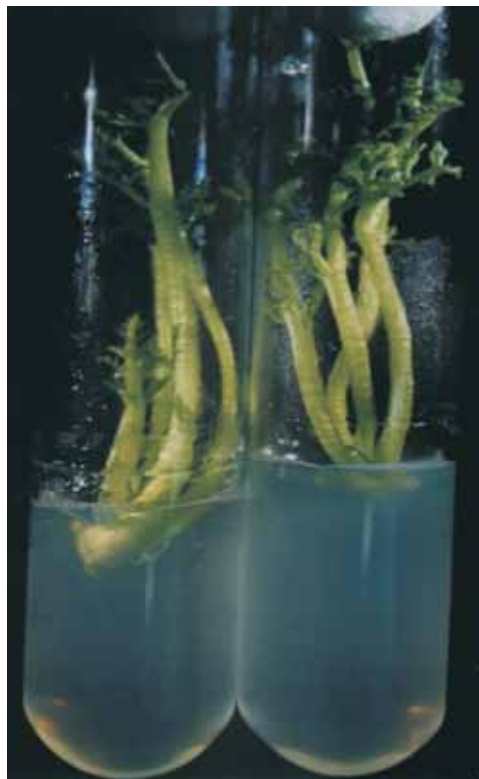
Fot. 2b. Regeneracja dwuetapowa — pędy przeniesione na pożywkę do ukorzeniania.