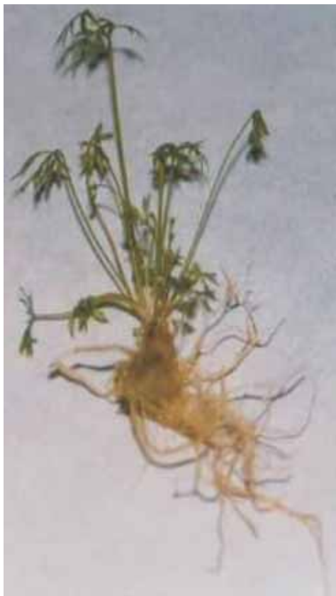
Fot. 2c. Regeneracja dwuetapowa — kompletna roślina.

roślin z jednego zarodka najbardziej embriogenicznej odmiany w ciągu 12. tygodni na pożywce B5. Zjawisko wtórnej embriogenezy w badaniach nad androgenezą w kulturach pylnikowych marchwi obserwowali Tiukavin i in. (4).